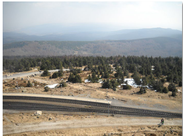
Abbildung 4: Blickrichtung Ost