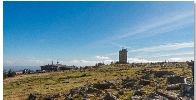
Abbildung 2: Gesamtansicht (2)