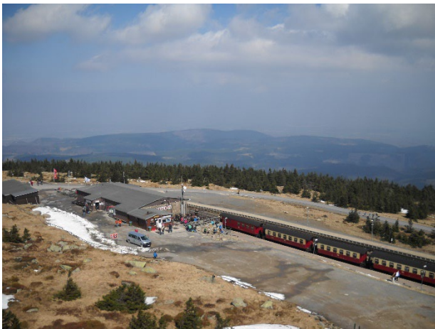
Abbildung 3: Blickrichtung Nord