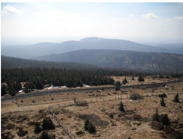
Abbildung 5: Blickrichtung Süd