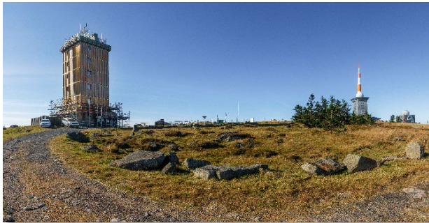
Abbildung 1: Gesamtansicht (1)