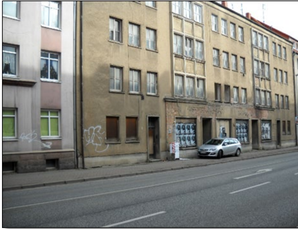
Abbildung 1: Gesamtansicht (1)