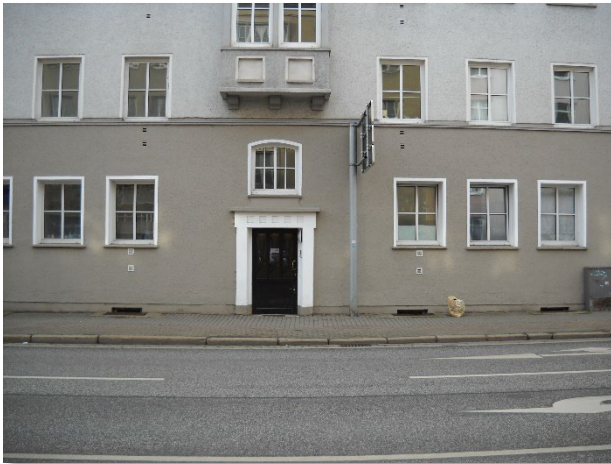
Abbildung 6: Blickrichtung Süd