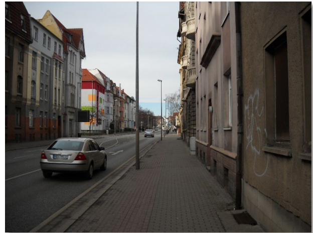
Abbildung 7: Blickrichtung West