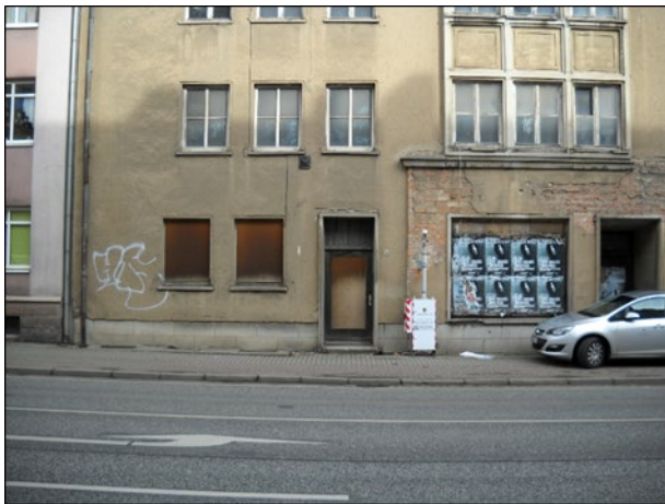
Abbildung 3: Gesamtansicht (3)