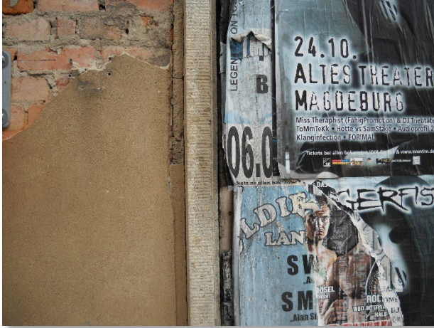
Abbildung 4: Blickrichtung Nord