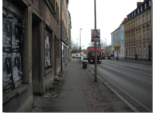
Abbildung 5: Blickrichtung Ost