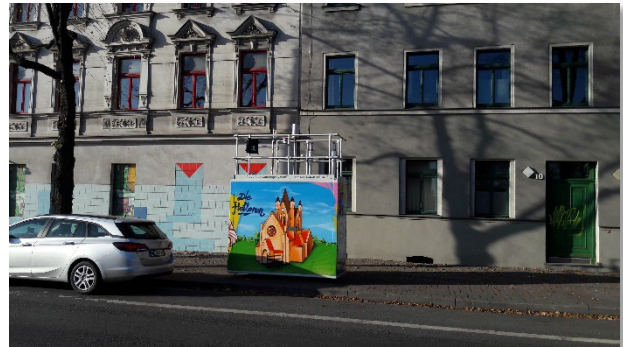
Abbildung 6: Blickrichtung West