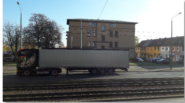
Abbildung 4: Blickrichtung Ost