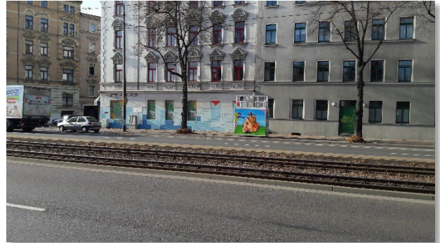
Abbildung 2: Gesamtansicht (2)