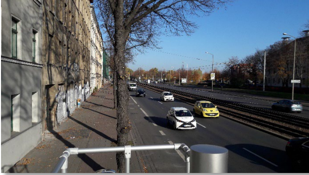
Abbildung 3: Blickrichtung Nord