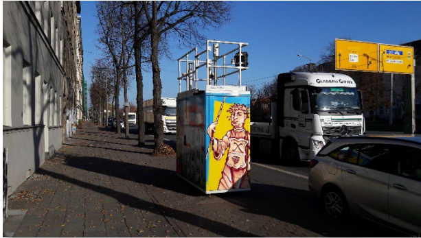
Abbildung 1: Gesamtansicht (1)