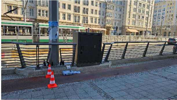
Abbildung 1: Gesamtansicht (1)