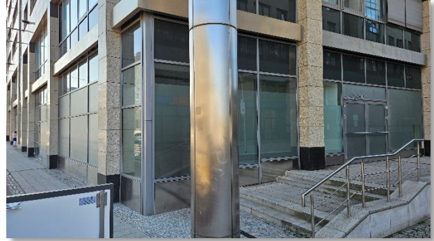
Abbildung 4: Blickrichtung Ost