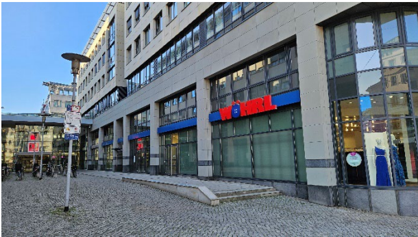
Abbildung 5: Blickrichtung Süd