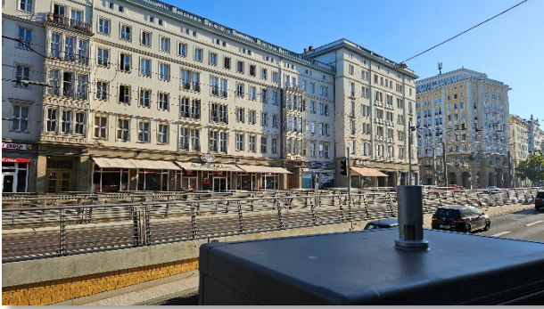
Abbildung 3: Blickrichtung Nord