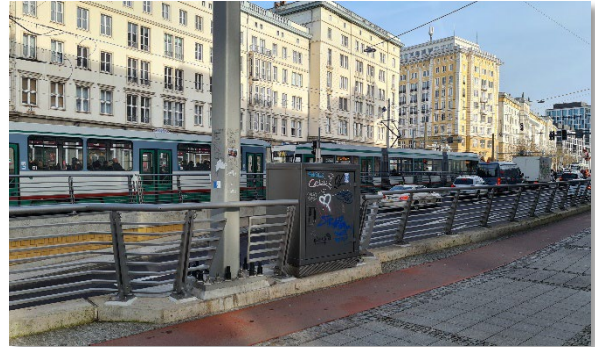
Abbildung 2: Gesamtansicht (2)